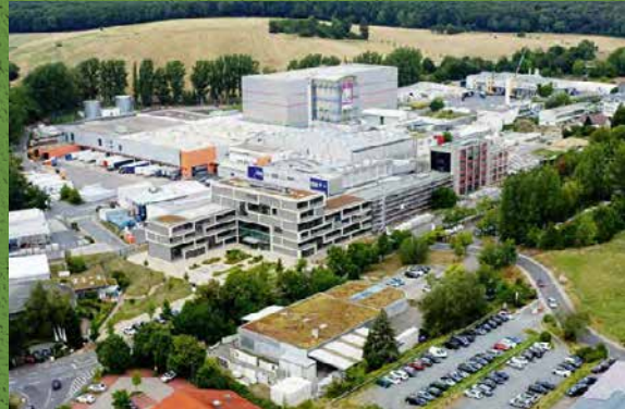
DAW siedziba w Ober-Ramstadt

Od 2012 roku jesteśmy sygnatariuszami inicjatywy United Nations Global Compact i co roku przekazujemy raport na temat naszych postępów w zakresie zrównoważonego rozwoju.